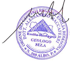
Tavola 3 Luglio 2015