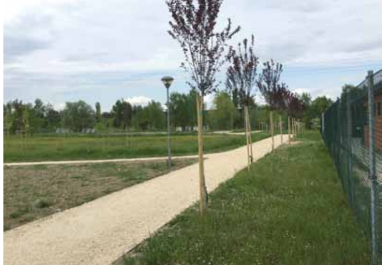
I nuovi alberi nell'area Case Gioia

Le minoranze hanno puntato il dito contro l'abbattimento degli alberi (nemmeno disposto dal Comune peral-