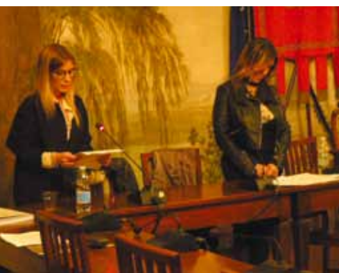
Un momento dell'incontro

Giovedì 21 aprile, nella sala del Consiglio comunale,