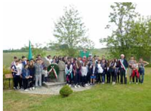
La camminata al monumento

recati in camminata fino al Monumento di Gabriella degli Esposti, sul greto del fiume. Sempre per i ragazzi si è svolto infine, al Circolo Arci di San Cesario, il reading Memoria , a cura di Compagnia Officine Duende, costruito sulla base di testimonianze di donne che hanno vissuto la Seconda Guerra Mondiale; dal ventennio di dittatura fascista fino all'entrata in guerra dell'Italia e alla Resistenza. Storie di quotidianità che ripercorrono frammenti di vita, parole raccolte nel tempo e giunte fino a noi.