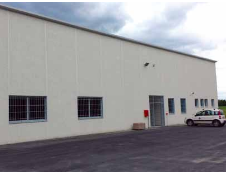
Il nuovo deposito comunale

Il patrimonio immobiliare del Comune è stato arricchito, grazie alla realizzazione di un nuovo deposito comunale della superficie di oltre 1000 metri quadrati, con annessa area cortiliva di 2.300 metri quadrati, realizzato con una spesa di 650.000 euro.