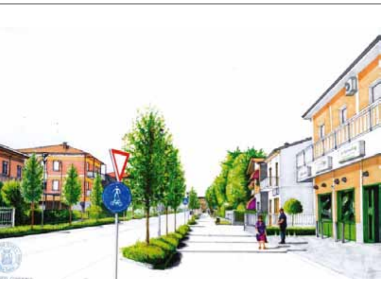
Rendering del progetto di viale V. Veneto

Preso atto di questa decisione della Provincia, come Amministrazione Comunale non abbiamo perso tempo, e subito abbiamo ragionato sul futuro del viale: la nostra volontà è quella di intervenire per ripristinare la tradizionale estetica di Viale Vittorio Veneto, caratterizzato da sempre dalle alberature a fianco della carreggiata.