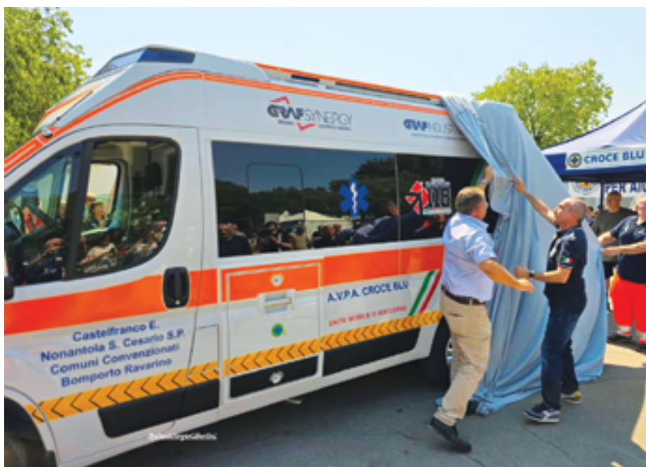
Foto: la nuova ambulanza donata all'Associazione

loro sostegno, e guardare con entusiasmo al futuro, con l'obiettivo di continuare a crescere e migliorare i servizi. Vi invitiamo a seguire i nostri aggiornamenti per scoprire tutte le iniziative che arricchiranno questo importante anniversario.