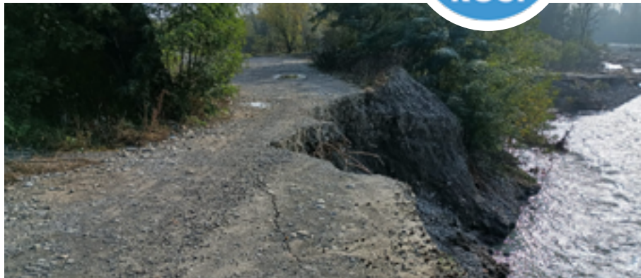
Foto: un'immagine del Panaro nel punto dove sta rompendo l'argine in direzione Canova