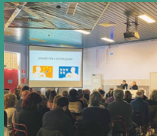
Foto: un momento dell'incontro del mattino con gli esperti

A seguire, una visita dermoscopica gratuita per i cittadini presenti, con l'obiettivo di una prima analisi dettagliata di eventuali situazioni che possono essere meritevoli di un approfondimento clinico. Un ringraziamento sincero a Canfield per questa giornata, fondamentale per ribadire ai cittadini l'importanza della prevenzione per la salute, della pelle, ma più in generale di tutti gli aspetti che riguardano la nostra salute.