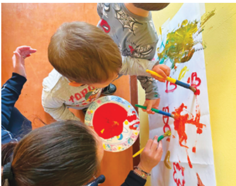
Foto: il Centro per le Famiglie è un luogo sicuro e accogliente per bambini e adulti

coli esplorano il mondo, apprendono nuove competenze e imparano a relazionarsi con gli altri. Per i genitori, partecipare a questi momenti significa osservare e comprendere meglio i bisogni dei propri figli, imparando a sostenerli nel loro percorso di crescita. Uno degli aspetti più significativi è la possibilità di instaurare legami relazionali positivi. In questi spazi, le famiglie hanno l'opportunità di confrontarsi con altre realtà, scambiare esperienze e trovare conforto nei momenti di difficoltà. Tale rete di supporto è fondamentale non solo per i genitori, ma anche per i bambini, che crescono in un ambiente stimolante e ricco di relazioni significative. Non solo un luogo fisico dunque, ma anche un'opportunità per costruire percorsi educativi condivisi dove l'interazione con educatrici qualificate e i costanti momenti di confronto rappresentano l'occasione per riflettere sulle proprie scelte educative e sentirsi parte di una comunità attiva e solidale. Questa dimensione comunitaria rappresenta un valore aggiunto in un'epoca in cui le famiglie possono sentirsi isolate o in difficoltà nel bilanciare le esigenze quotidiane con il benessere dei propri figli.