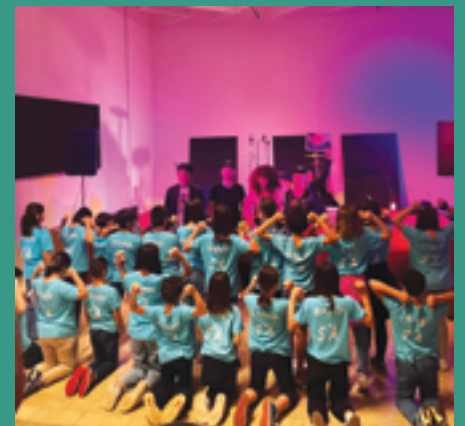
Foto: uno degli eventi musicali dell'Accademia di Pan

rienze artistiche e stimolando la riflessione su temi sociali e culturali di grande attualità.