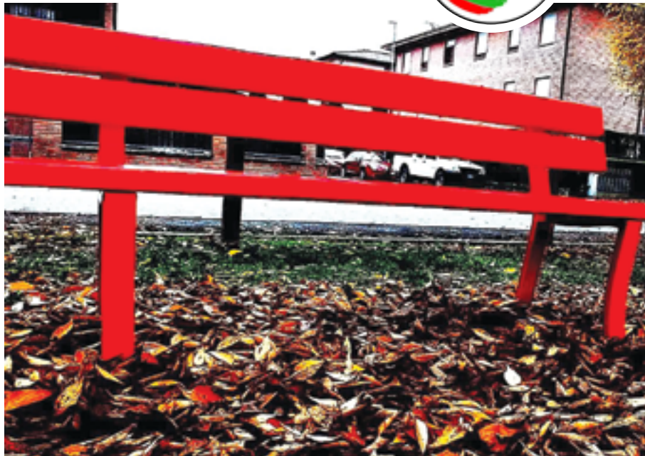
Foto: la panchina rossa contro la violenza sulle donne nel parco di Sant'Anna

Si tratta di un progetto rivolto ai ragazzi delle scuole medie di San Cesario, che ha preso vita anche grazie al sostegno della fondazione Peppino Vismara e che si pone l'obiettivo di contrastare l'abbandono scolastico attraverso l'organizzazione di uno spazio doposcuola gratuito gestito da educatori professionali presso Villa Boschetti, sportelli di ascolto e laboratori con lo scopo ulteriore di affiancare i ragazzi nella scelta della scuola superiore e accompagnarli nel loro percorso. Un progetto che stimola i ragazzi a pensare oltre ad "oggi" e affacciarsi ad un "domani" che costituirà parte fondamentale del loro percorso di crescita personale e scolastica. Kino Campus, sportello di ascolto e doposcuola presso Villa Boschetti.