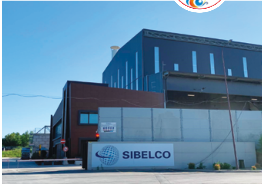
Foto: la fabbrica Sibelco di San Cesario

Modena affronteremo un appuntamento importante quale il processo contro Far Pro dove ci siamo costituiti parte civile, senza il sostegno dell'amministrazione. Non ci stancheremo mai di denunciare, che la polvere di vetro costituisce un pericolo per la salute, soprattutto per i bambini, che frequentano i campi sportivi, perché s'insinua negli alveoli polmonari e non ne esce più generando patologie respiratorie. A sostegno di quanto affermato esistono diversi studi e pubblicazioni scientifiche, che possono essere consultati online e ci sono i dati ufficiali dei rilievi della qualità dell'aria compiuti da Arpae. Non capiamo la rassegnazione della maggioranza dei sancesaresi ad accettare questo stato delle cose e ci domandiamo increduli, dove sia finita la tanto acclamata solidarietà. In vista delle feste natalizie dove tutti tendiamo a far uscire la parte migliore, potremmo provare a immaginarci per un momento nei panni di chi denuncia da tanto tempo il disagio della polvere di vetro, oppure quello dei miasmi, insomma per una volta potremmo fargli sentire il calore della nostra vicinanza. Cogliamo l'occasione per augurare a tutti i cittadini, un Felice Natale e un Buon Anno 2025. Gruppo Centrodestra per la Rinascita.