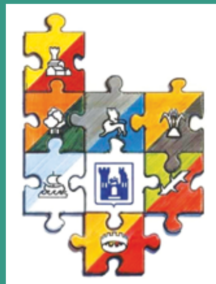
Foto: il logo dell'Associazione Le Contrade di San Cesario

apprezzata dai ragazzi in età scolastica, Luppolandia che ci dà una grossa mano ad innovare le feste con idee sempre nuove, i "Maestri della griglia" dell'IGC/BBQ con le loro specialità e naturalmente tutti coloro che singolarmente o in piccoli gruppi ci supportano negli eventi. Buone Feste a tutti i sancesaresi dalle Contrade!