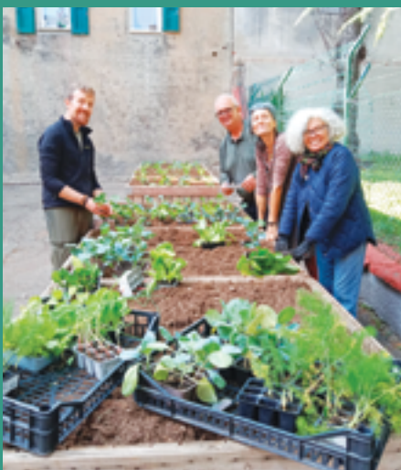
Foto: l'orto urbano di via Piave promosso da Aimo

Siamo risultati vincitori di un bando regionale per il rafforzamento delle reti ecologiche territoriale e la conservazione della biodiversità. Questo progetto prevede due interventi principali: la realizzazione di 4 nuovi stagni permanenti, per creare un ambiente adatto a tutte le specie che prediligono le zone umide; i nuovi stagni saranno realizzati in prossimità di quello esistente e saranno collegati tra loro per creare un ambiente unico. Oltre a questo, si prevede di realizzare circa 900 metri quadrati di nuovi prati fioriti, che garantiranno un habitat ideale per la conservazione di numerose specie animali. Oltre migliorare l'estetica e il decoro dell'area dei laghi di Sant'Anna, questi nuovi ambienti verdi permetteranno di rendere l'area ancora più idonea per lo sviluppo di specie animali e vegetali.