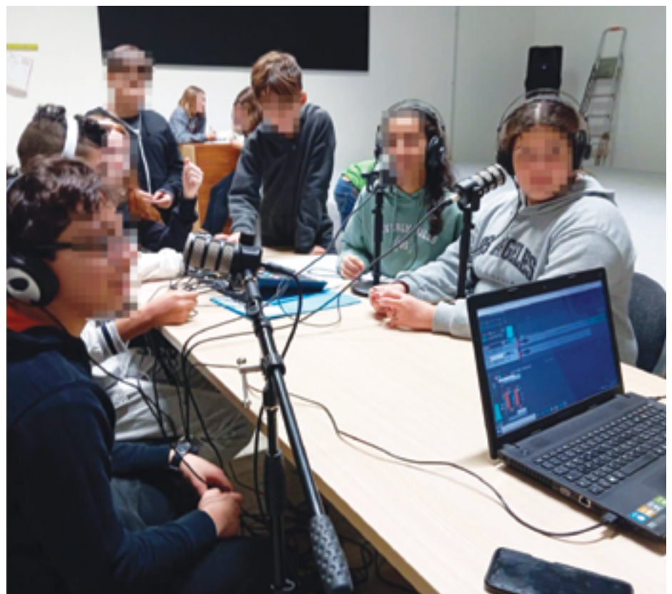
Foto: da pochi giorni è partito il laboratorio di web radio Voci dal campo

Dopo l’indagine #ideagiovani fatta nel 2021/22 abbiamo voluto continuare il lavoro per creare sempre di più un paese a misura di giovani. Con il progetto “Orientamenti” traduciamo in pratica questo obiettivo, offrendo momenti strutturati di aggregazione e crescita per i ragazzi di San Cesario. L’obiettivo non sarà solo quello di avere attività partecipate e utili, ma fare in modo questo sia il punto di partenza per un nuovo protagonismo giovanile, che porti i ragazzi stessi a farsi promotori di nuove proposte e idee.