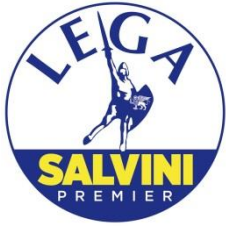
GRUPPO CONSIGLIARE "LEGA SALVINI PREMIER" DI CASTELFRANCO EMILIA