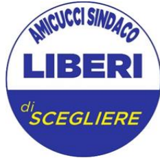
GRUPPO CONSIGLIARE "LIBERI DI SCEGLIERE" DI CASTELFRANCO EMILIA