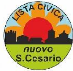
GRUPPO CONSIGLIARE "NUOVO SAN CESARIO" DI SAN CESARIO SUL PANARO