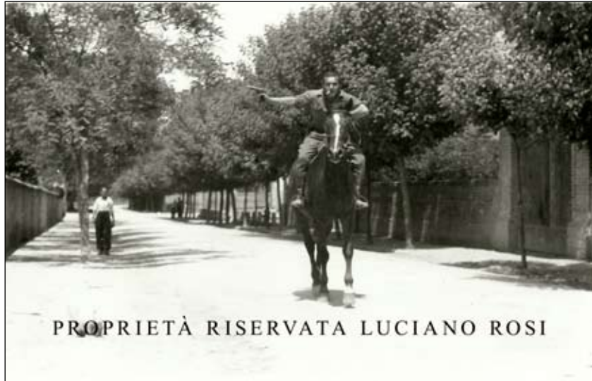
PROPRIETÀ RISERVATA LUCIANO ROSI

Valor Militare. Dopo tanto tempo trascorso via da casa, quando rientrò a San Cesario non trovò lavoro ed emigrò in Corsica, dove per due anni divenne capomastro presso un cantiere edile. Esuberante e dallo spirito mai domo, in seguito a qualche intemperanza dovette fare ritorno a San Cesario e lavorò in Cartiera per due anni. Poi si trasferì definitivamente a San Lazzaro e lavorò sino alla pensione presso un'impresa di spedizioni internazionali. È stato pittore, scultore e anche poeta, una sua canzone venne acquistata da una casa discografica milanese e il suo memoriale di guerra utilizzato dal Comune di San Lazzaro per una pubblicazione rivolta agli studenti.