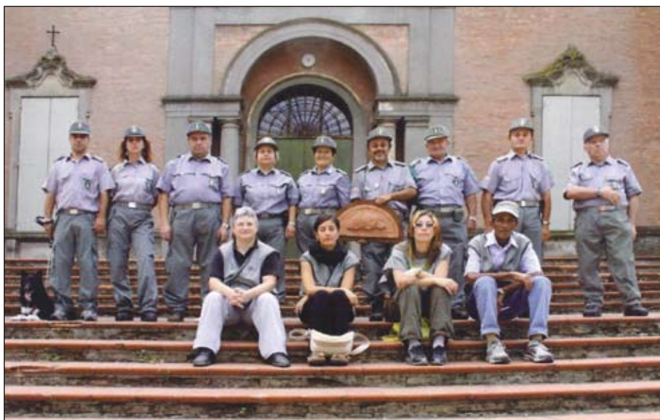
UNA PARTE DELLE GEV OLTRE PANARO