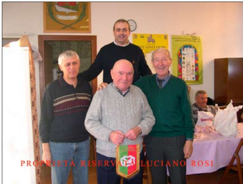
PROPRIETÀ RISERVATA LUCIANO ROSI