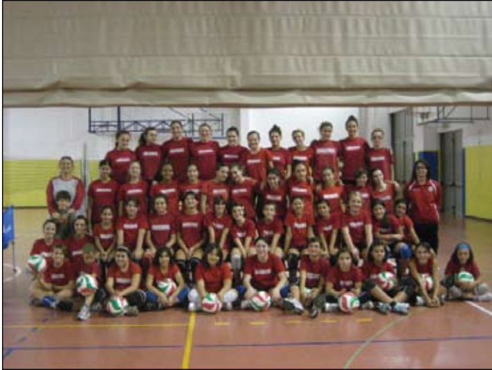
Foto il gruppo agonistico del settore volley, dall'under 12 all'under 17.

Oltre ai brillanti risultati ottenuti nel mese di luglio, dove la squadra under 13 ha vinto il titolo tricolore Uisp, il nostro settore è particolarmente soddisfatto e orgoglioso nel vedere che il numero di bimbi e bimbe che partecipano ai nostri allenamen-