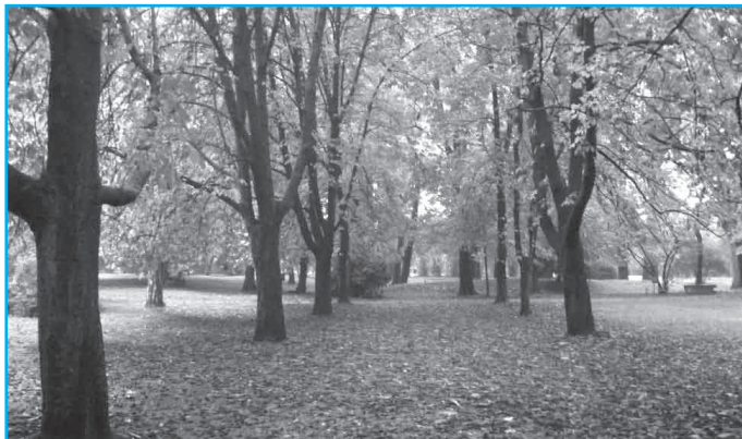
Il parco di Villa Boschetti, sede del corso

Si sa che una regolare attività mentale e fisica assieme a una ricca vita sociale possono allontanare nel tempo l'insorgenza di demenza in età senile, in particolare il morbo di Alzheimer. Per questo l'Amministrazione comunale, in collaborazione con l'Ausl di Modena realizzerà il progetto "Allenamento alla memoria". Il progetto è composto da due parti distinte, ma collegate tra loro: