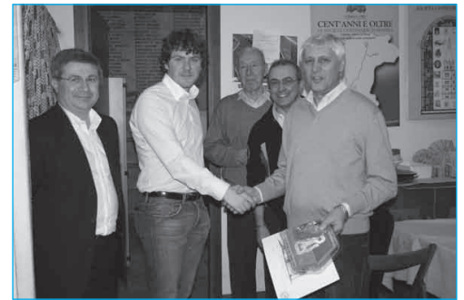
Due momenti della premiazione