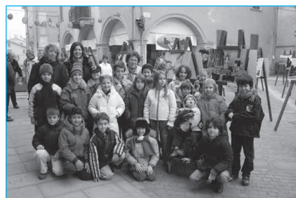
I ragazzi delle scuole in visita alla mostra delle cartoline d'epoca