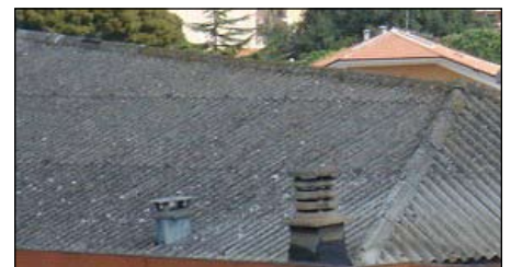
Il tetto di un'abitazione ricoperto con lastre ondulate di eternit

tazioni. Sappiamo tutti che l'eternit esposto alle intemperie, con il passare del tempo, arriva a sfaldarsi. In quel momento diventa pericoloso per la salute ed è obbligatorio trat-