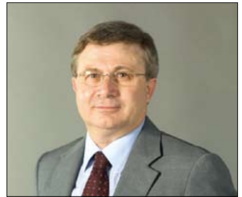
Il Sindaco Valerio Zanni

L'impossibilità di utilizzare le entrate da vendite immobiliari, la crisi economica e il rispetto del patto di stabilità, ci hanno precluso la vendita di alcuni immobili di patrimonio del Comune. Nel quadro delle alienazioni che la direttiva del Governo ci chiede di mettere in attuazione per riqualificare le entrate da vendite immobiliari riconfermiamo, le procedure per l'alienazione delle strutture comunali dell'ex Macello, dell'ex Cinema e della Torretta presso il campo sportivo. La vendita di questi immobili oltre a mettere a disposizione risorse per la realizzazione di investimenti, darebbe la possibilità di riqualificare aree importanti del centro storico e presso il campo sportivo.