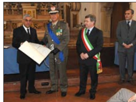
Il Generale Adami premiato con l'onorificenza dell'Ordine al Merito della Repubblica italiana

incarichi presso lo Stato Maggiore dell'Esercito a Roma; il Comando delle Forze Alleate del Sud Europa a Verona. E' stato comandante del Battaglione allievi del 177° Corso presso l'Accademia di Modena; del 127° Reggimento Artiglieria contraerea Ravenna a Bologna; del Comando Militare Esercito Emilia Romagna; della Scuola Interforze per la Difesa Nucleare Biologica e Chimica a Rieti. Dal 16 novembre 2009 è Capo di Stato Maggiore del Comando Militare Esercito Toscana a Firenze.