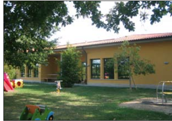
La scuola materna Sighicelli

Avremmo preferito maggiore responsabilità da parte dei consiglieri di