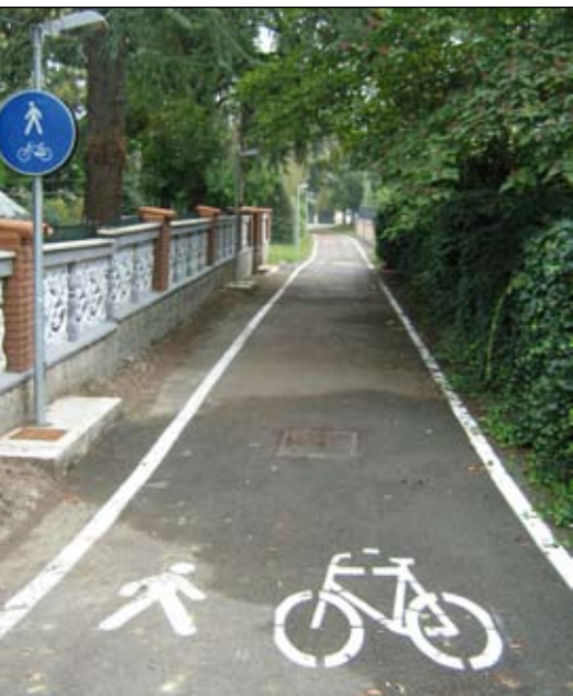
La pista ciclabile di via delle Fosse con la nuova illuminazione

Manutenzione straordinaria strade comunali: sono stati ultimati i lavori di bitumatura e manutenzione straordinaria di diverse strade comunali, in particolare sono stati rifatti il cassonetto stradale e il manto d'usura di Via Viazza, nel tratto che scorre all'interno della zona artigianale della Graziosa, sono stati eseguiti risanamenti e bitumature in Via Dante Alighieri per la ripresa di vecchi scavi e assestamenti, è stato rifatto il manto d'usura in Via Bagnese in corrispondenza dell'intersezione con la Via Emilia, è stato eseguito