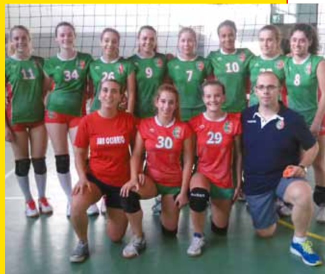
Le ragazze Under 16