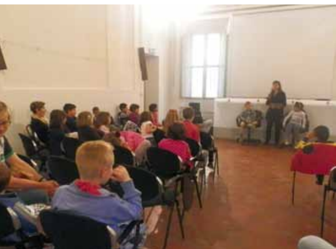
Incontro con l'autrice

L'autrice di narrativa per ragazzi ha raccontato ai piccoli "Che pasticcio", "Ciccio mangia troppo", "La Signora Costy" e "10 storie per riflettere".