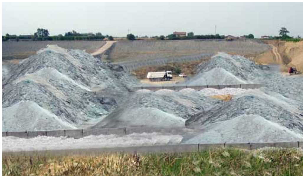
Una "cava di vetro"

DACO, AMMINISTRATORI, siamo tutti con voi per risolvere definitivamente il problema. I Consiglieri Comunali rappresentano tutta la gente di San Cesario. Noi siamo dalla loro parte e votiamo con voi tutti assieme per dire basta! " In 20 anni non è mai stata trovata la soluzione ottimale, solo palliativi, carte bollate, denunce, ma mai nulla di