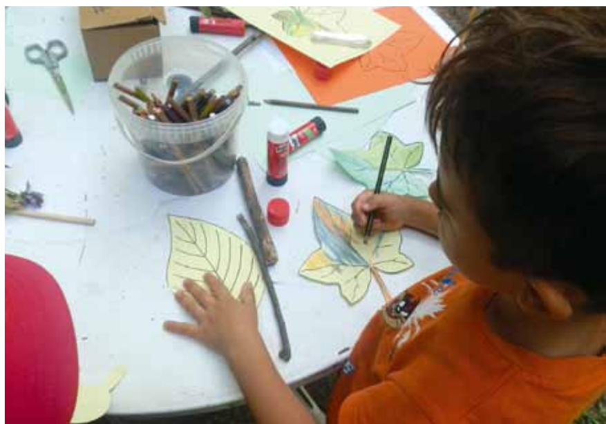
Laboratorio al parco