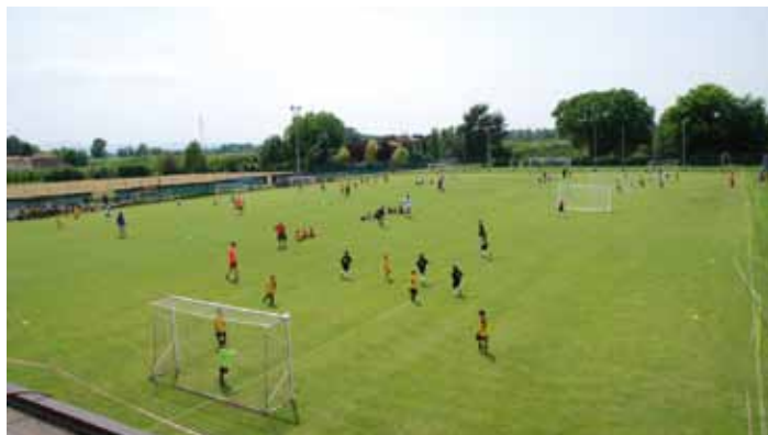
Un momento del torneo

In una piccola realtà come quella di S. Anna, è stato entusiasmante veder partecipare così tante persone, a conferma che la strada percorsa è quella giusta. Per noi, il "1°Torneo Super Cup" è stata una sfida superata a pieni voti, anche grazie a tutti quei volontari che, con impegno e dedizione, hanno reso possibile la riuscita dell'evento. La nostra è una comunità unita da principi veri, quali capacità di aggregazione; senso dello sport e voglia di divertirsi insieme. Avremo occasione di incontrarci anche il prossimo anno, dato che vorremmo che questa splendida manifestazione diventasse un appuntamento fisso per il paese, da non perdere.