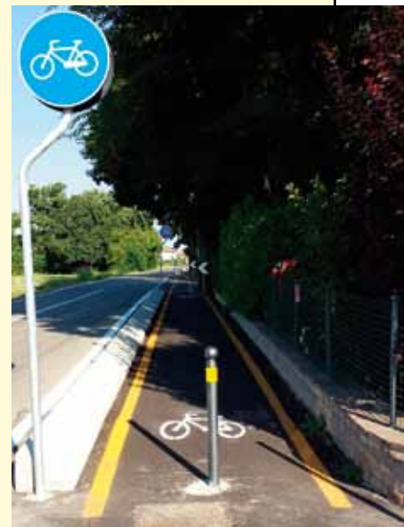
Ciclabile in via Liberazione

Roversi e la ciclabile di via Artioli, verso Spilamberto. Ogni parte sarà funzionale alla realizzazione del Piano più ampio, con una funzione definita e una propria validità. Ad esempio, nella pianificazione generale è previsto di prolungare anche la ciclabile che passa davanti alla Coop fino a Case Baietti (via Imperiale): non si tratta di un percorso destinato ad arrivare a Piumazzo, e quindi incompiuto, ma di un percorso in sede protetta che consentirà agli abitanti di Case Baietti di raggiungere il paese in sicurezza . Inizieremo anche ad investire le prime risorse riconosciuteci da Società Autostrade per gli interventi di riforestazione , compresi nelle opere compensative per la realizzazione della quarta corsia autostradale. Procedere alla messa in sicurezza del ponte sull'A1 di via Modenese sarà un altro degli obiettivi da raggiungere quest'anno. Stiamo mettendo le basi per la crescita di San Cesario, un mattone alla volta, come richiedono gli edifici più solidi.