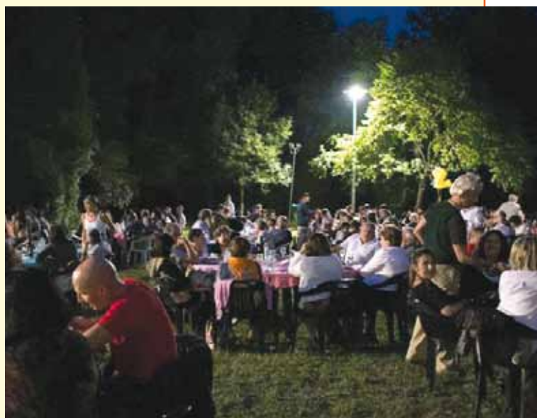
La serata del Gruppo Schegge