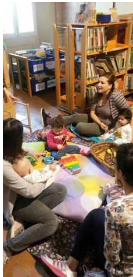
Concerto di piccolissimi

lattamento, capricci ed emozioni legate al parto, alla presenza di un'educatrice qualificata che le ha accompagnate e guidate utilizzando anche i libri tematici presenti nello spazio bimbi e negli scaffali dedicati ai genitori. Nell'ultimo incontro, dedicato alla musica, i bimbi hanno potuto improvvisare un piccolo concerto con strumenti musicali in legno, come tamburelli e xilofoni, per poi addormentarsi serenamente tra le braccia della mamma.