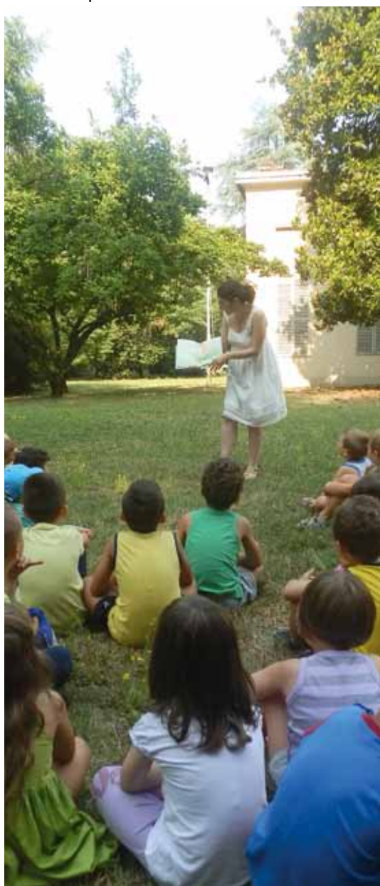
Letture al parco

Gli operatori presenti aiutano gli utenti ad iscriversi al progetto regionale YoungERcard (che consente di ottenere una serie di agevolazioni e sconti per i servizi culturali e sportivi e per diversi esercizi commerciali, e per partecipare ad attività di volontariato); affiancano i giovani nella compilazione del curriculum vitae e li informano sulle offerte di lavoro disponibili, sulle opportunità per il tempo libero, e sulle esperienze all'estero.