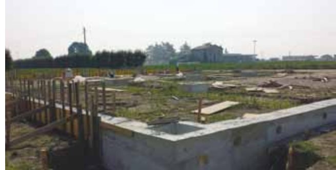
Il cantiere del nuovo magazzino comunale

L'ulteriore riduzione dei trasferimenti. Per redarre un Bilancio di previsione affidabile, non bastano ai comuni le indicazioni generali imposte sulle leggi di stabilità. Non bastano linee guida generiche, approvate negli ultimi giorni di dicembre, i cui criteri di attuazione vengono individuati in molti casi solo nei mesi successivi. Auspichiamo che il Governo possa da una parte trovare le risorse e le energie per tornare a fare crescere il nostro Paese, e dall'altra che possa dare ai Comuni la possibilità concreta di disporre delle risorse dei territori amministrati. E' il momento di superare l'ipocrita espressione di un federalismo fiscale che obbliga alla scelta tra taglio dei servizi o aumento della tassazione locale. L'annunciata ristrutturazione della tassazione locale (Local Tax?) può centrare l'obiettivo soltanto se il Governo riconoscerà alle nostre realtà il diritto di trattenere sul territorio una parte maggiore delle entrate complessive che oggi vengono dai cittadini. C'è un'esigenza diffusa di equità e trasparenza nella distribuzione delle risorse pubbliche, sia tra Stato e Comuni, che