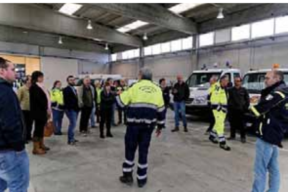
I volontari al centro di Marzaglia

E' con lo slogan "Volontari si diventa" che, nella primavera dello scorso anno, ha preso avvio il progetto dell'Amministrazione comunale di formare un proprio Gruppo di volontariato di protezione civile . Costituire un gruppo di protezione civile locale, all'interno del sistema regionale e nazionale, rappresenta sicuramente un valore aggiunto sia per il paese in sè stesso che per tutto il sistema. Un gruppo di volontari ha messo a disposizione parte del proprio tempo per svolgere un'azione di controllo e di