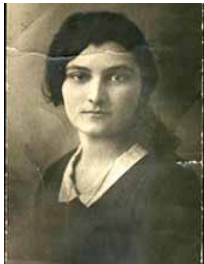
Gabriella Degli Esposti

Tante poi furono le donne che combatterono al fianco dei partigiani: imbracciarono le armi, si misero al fianco degli uomini e in alcuni casi venivano scelte come capi squadra. Le donne portarono anche un grande supporto morale all'interno del gruppo, essenziale in quei momenti così difficili. Tante sono state le donne combattenti catturate e seviziate, portate in campi di concentramento e poi condannate a morte. Questa giornata, dedicata alla Liberazione, per noi è stata una tappa importante per capire e vivere direttamente dalle protagoniste il ruolo fondamentale che le donne hanno ricoperto durante la Seconda guerra mondiale, mettendo in luce la loro costante forza d'animo, la determinazione e l'amore per il proprio Paese. Un percorso, quello delle donne verso la parità dei diritti e delle opportunità, che non deve subire battute d'arresto.