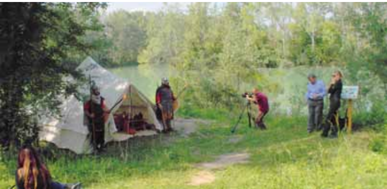
Un'immagine delle riprese ai laghetti

Guidate dal personale del settore LL.PP. - Tecnico manutentivo dell'ufficio tecnico, la troupe RAI nel pomeriggio del 12 maggio ha svolto un sopralluogo sul sito, rimanendo favorevolmente impressionata dal paesaggio e verificandone l'adattabilità quale sfondo delle scene previste nel copione.