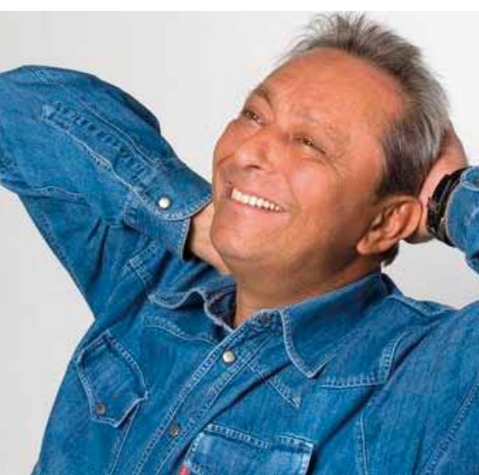
Il comico Duillio Pizzocchi

Durante "La Nostra festa" il pubblico potrà visitare nelle sale espositive di Villa Boschetti la " Mostra di pittura, scultura e collezionismo ", a cura dell'Associazione Culturale "L'arte nel tempo libero"