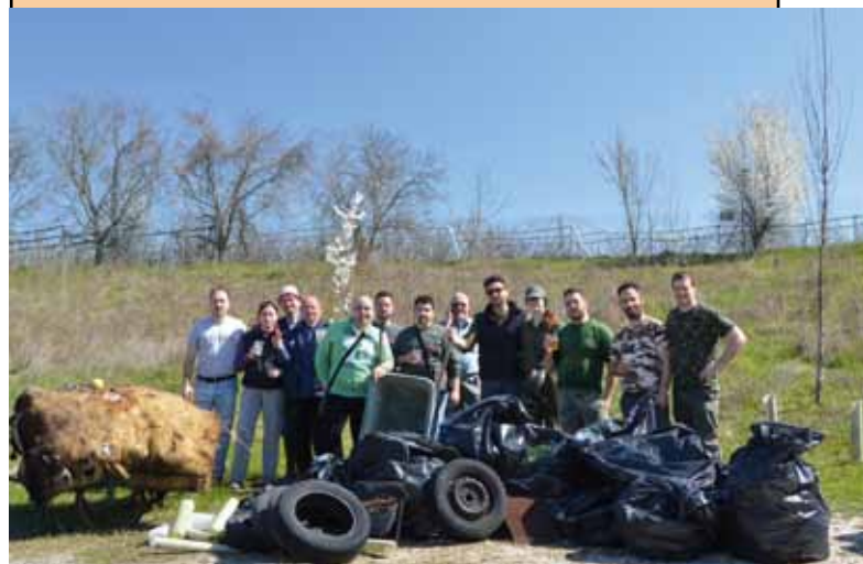
Foto di gruppo per la Giornata Ecologica