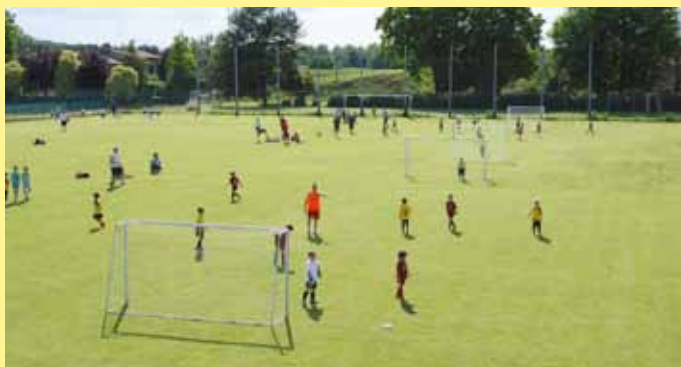
Una partita del torneo

L'11 e il 18 giugno si sono svolti presso il campo sportivo comunale A. Romagnoli di S. Anna i tornei di calcio giovanile per le categorie 2007 e 2008/2009, a cui hanno partecipato 12 formazioni per un totale di circa 130 bambini. La manifestazione ha avuto successo, sia a livello organizzativo che di pubblico, ed ha visto trionfare per la categoria 2007 la Young Boys Cognentesi , e per i 2008/2009 la Pol. Manzolino . Alla Premiazione, oltre al presidente dell'Archi Sant'Anna