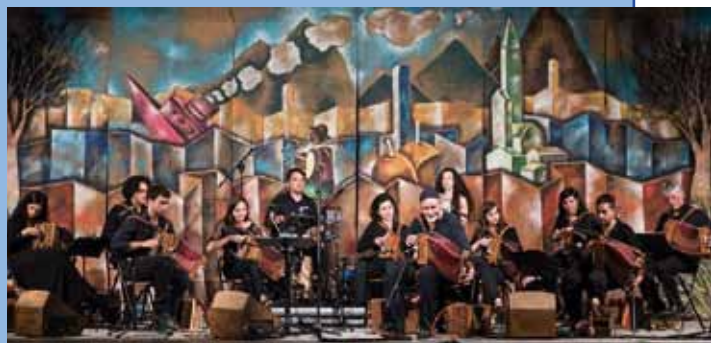
Il Giardino della Pietra Fiorita