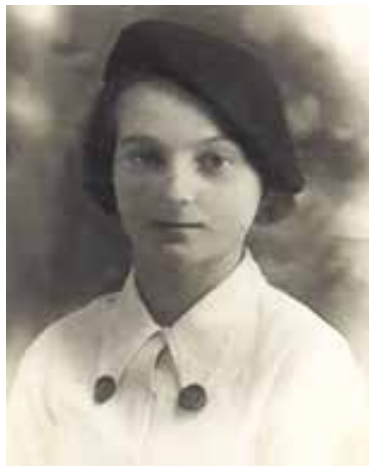
La divisa da piccola italiana