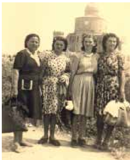
Maggio 1946: gita in bici a San Luca

Luca con le mie amiche. Avevamo le borse con il mangiare. Io non avevo neanche la bicicletta, me la prestò un'amica: era la bicicletta di suo fratello. Sono andata al santuario con una bicicletta da uomo, perché le biciclette le avevamo, ma erano rimaste senza le gomme, perché con la guerra non si trovavano più le gomme, poi avevano messo le gomme piene e si faceva molta fatica a pedalare. L'amica che mi ha prestato la bicicletta aveva