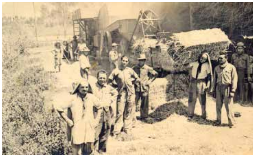
Trebbiatura alla Graziosa

Quindi, in questo periodo, avevo il tempo per le amiche e non mi sono mai pentita.