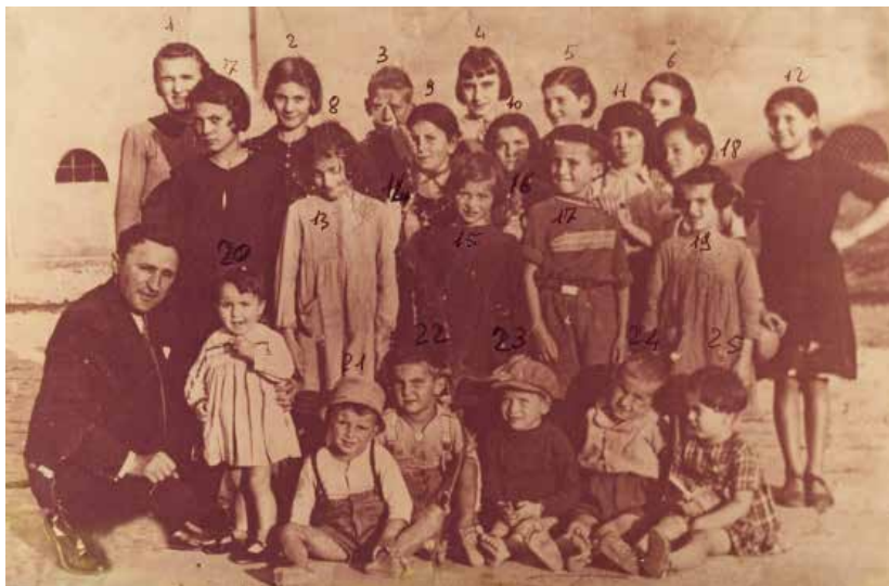
I bambini della Graziosa

La mia sorellina più giovane si era ammalata, era noiosa. Allora la mamma mi supplicò: “Dàg un pogh la bambola, dàg un pogh la bambola!” [1] A malincuore gliel’ho