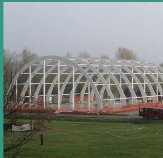
Foto: Lo scheletro della copertura della palestra in via Ghiarelle