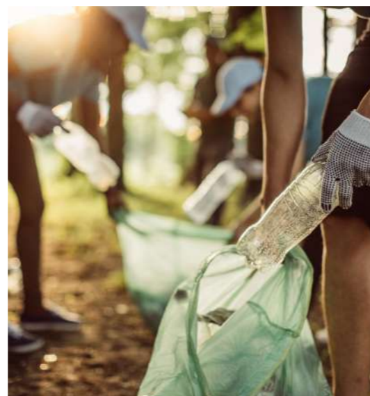
Foto: Il 22 dicembre si terrà la prima giornata di pulizia delle aree verdi

Per maggiori informazioni scrivere a ecovolontarisancesariosp@gmail.com .