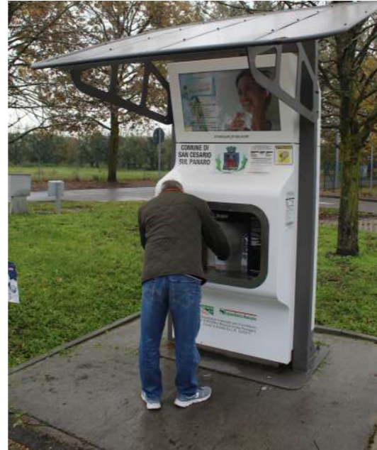
Foto: Dopo 7 mesi di utilizzo la Casetta dell'acqua ha erogato 65mila litri di acqua

sente sul fianco della casetta dell'acqua. Il punto di erogazione si trova nell'area verde antistante la scuola e la palestra scolastica. Anche questa scelta non è casuale: si è cercata una zona comoda, dotata di parcheggio e facilmente accessibile. Ma la scelta di posare l'opera nella zona scolastica vuole trasmettere la volontà di dare un segnale alle giovani generazioni rispetto all'adozione di stili di vita più sostenibili per l'ambiente. Per questo progetto il Comune ha ottenuto un cofinanziamento di 25mila da parte dell'Agenzia Territoriale dell'Emilia Romagna per i Servizi Idrici e Rifiuti, grazie alla partecipazione al bando specifico per questi interventi. La parte restante di risorse necessaria per completare l'investimento è stata finanziata dal Comune per una quota di circa 6mila euro, per un costo complessivo per l'opera di 31mila euro.