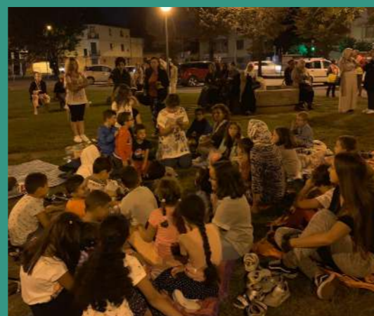
Foto: La serata finale di ParchiAmo in Piazza Nenni a San Cesario

e festosa partecipazione. A tutti diciamo grazie e ci diamo appuntamento per le prossime iniziative.