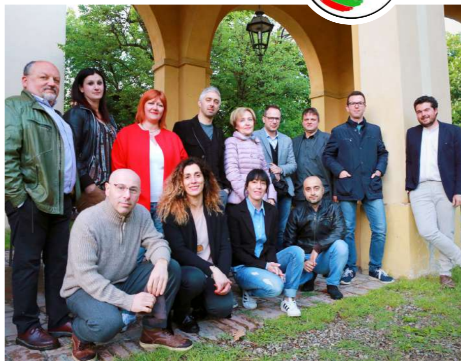
Foto: I candidati delle passate elezioni della Lista Insieme per San Cesario

Se da un lato siamo convinti che gran parte dei cittadini stia cogliendo il senso del lavoro svolto, dobbiamo constatare con amarezza che il livello della discussione politica in Consiglio viene svilito da interrogazioni e mozioni per lo più pretestuose, dando