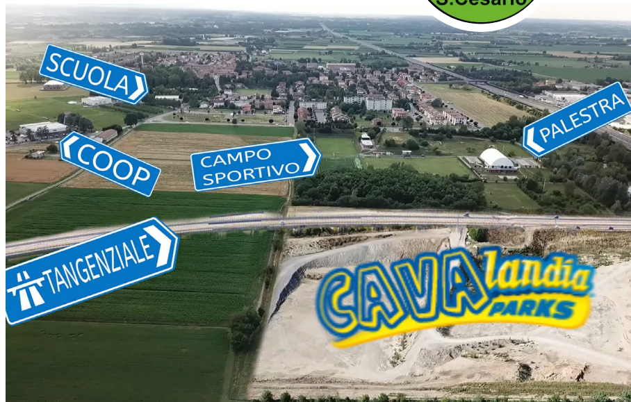
Foto: Vicino al paese aprirà presto Cavalandia, il nuovo parco divertimenti esclusivo a San Cesario

Prima di vederlo però dovremmo attendere almeno otto anni, non se ne parla fino al 2028. Lo ha confermato il Sindaco in risposta ad una nostra interrogazione: prima del parco dovrà infatti essere realizzata la tangenziale ed i terrapieni a fianco dell'autostrada (termine lavori nel 2023, presumibilmente). Poi occorrerà attendere altri cinque anni (come minimo...) per far scavare la ghiaia in cava Ghiarella. Non si capisce perché per avere il parco a fianco dell'autostrada dobbiamo prima attendere che venga scavata la cava. Cosa c'entra la cava col parco? I nostri Amministratori hanno così deciso: l'escavazione di ghiaia in pieno centro abitato viene prima della realizzazione di un parco di quasi 12 ettari. L'estate è terminata ma il bacino irriguo di Altolà, la grande opera da cinque milioni di euro che avrebbe dovuto servire ben 170 aziende agricole, anche quest'anno non è entrata in funzione. Un grande flop, un lago abbandonato con problemi di tenuta. Nel 2018 le sponde sono crollate ed il Comune per farle risistemare ha dovuto ricor-