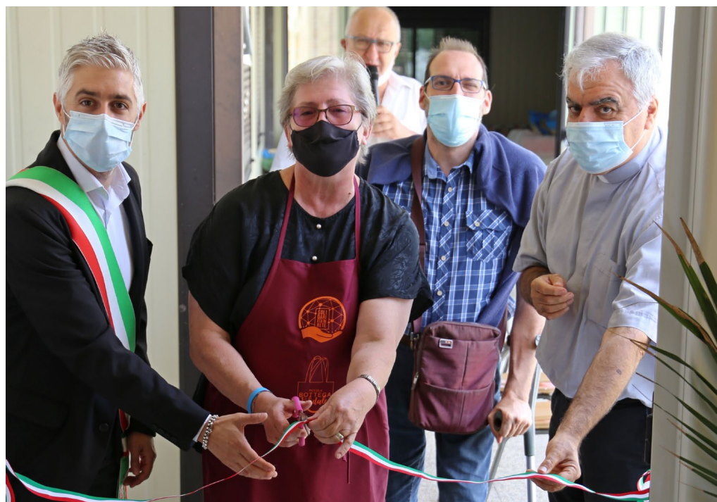
Foto: Taglio del nastro per la Piccola Bottega Solidale

Per noi è stato un giorno bellissimo in quanto abbiamo avuto vicini tante persone che hanno potuto verificare di persona quanto stiamo facendo. È stato coinvolgente avere con noi i rappresentanti delle Istituzioni, sentirli vicini, condividere il nostro progetto: un grazie a loro per aver voluto partecipare. Il ringraziamento più grande va però a tutte le volontarie ed i volontari che quotidianamente mettono a disposizione il loro tempo per aiutare le persone più deboli, quelle in difficoltà.