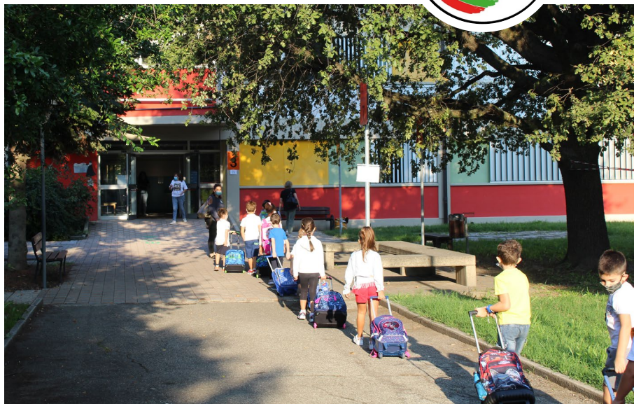
Foto: Con le dovute precauzioni, riparte anche la scuola a San Cesario

Le politiche giovanili rimangono un focus da sviluppare al meglio ed un punto cardine del nostro programma. In una direzione analoga, ma che coinvol-