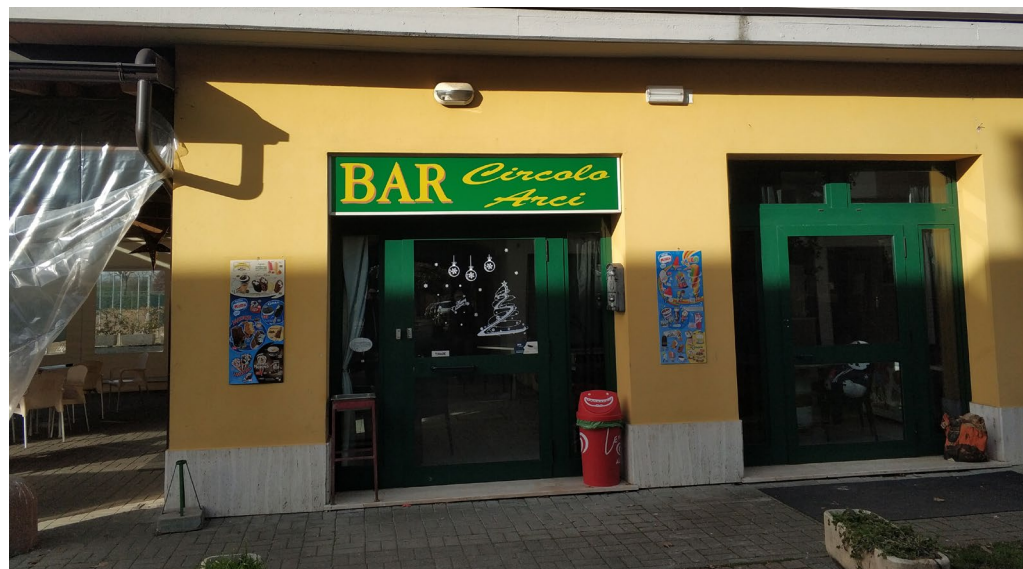
Foto: L'entrata dell'ex Circolo di Sant'Anna oggetto di prossima trasformazione

aggregazione, un presidio commerciale per contrastare fenomeni di rarefazione del sistema distributivo e dei servizi e allo stesso tempo anche un presidio del territorio in termini di sicurezza. Ci sarà una discontinuità con quanto avvenuto in passato, ma non abbiamo paura di cambiare perché credo che la soluzione proposta possa portare beneficio alla frazione e contribuire a raggiungere gli obiettivi che ci siamo posti”.