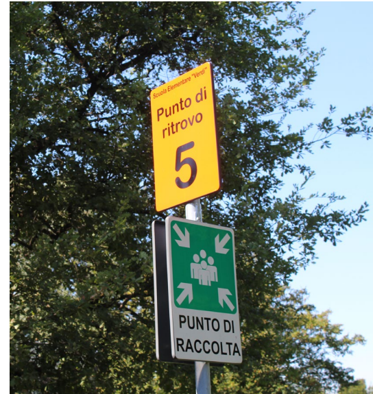
Foto: La segnaletica adibita per il rientro in sicurezza

I servizi hanno preso il via in modo regolare, senza il ricorso a didattica a distanza o altre situazioni di emergenza come l'alternanza nelle classi. Anche i tempi scuola non hanno subito variazioni significative rispetto agli anni precedenti. Per centrare questi obiettivi sono stati necessari inter-