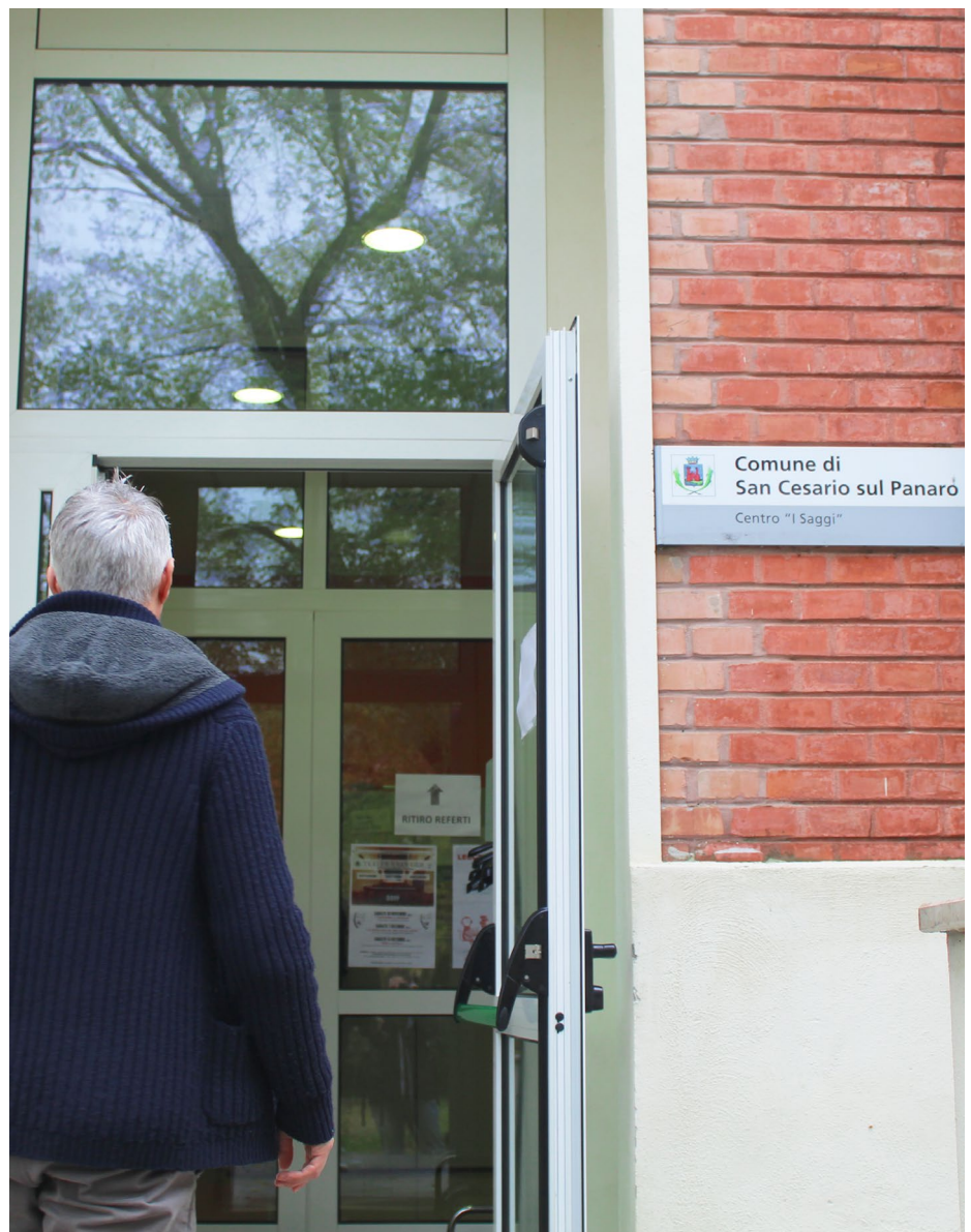
Foto: L'entrata del Centro

“Riprendere le attività per tornare a partecipare, interagire e incontrarsi”