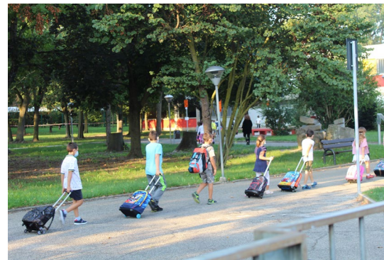
Foto: L'entrata del primo giorno di scuola

Dal 23 settembre hanno preso il via anche i servizi di trasporto, mensa e pre-scuola dopo una riorganizzazione che sarà misurata con il tempo per lo svolgimento dei servizi nel pieno rispetto delle norme anti-Covid. Dal 5 ottobre partirà anche il post-scuola, fondamentale per tante famiglie del paese, garantito anche per l'anno educativo 2020/21.