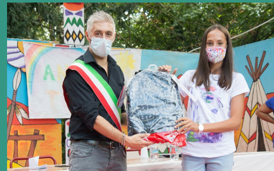
Foto: Uno scatto della premiazione del concorso